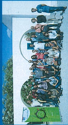
Génération A'Yanir - 3ème Promotion